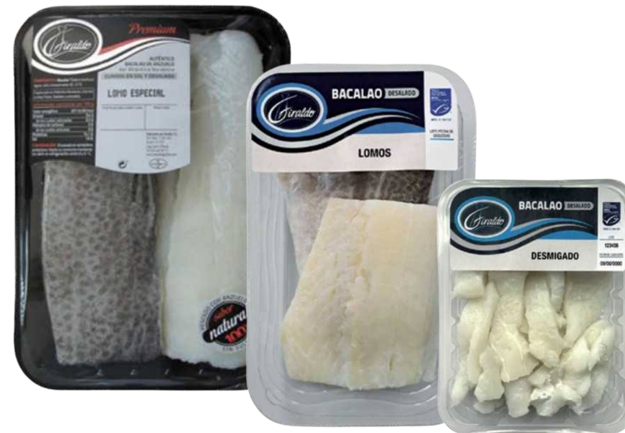
Morue Dessalée Réfrigérée