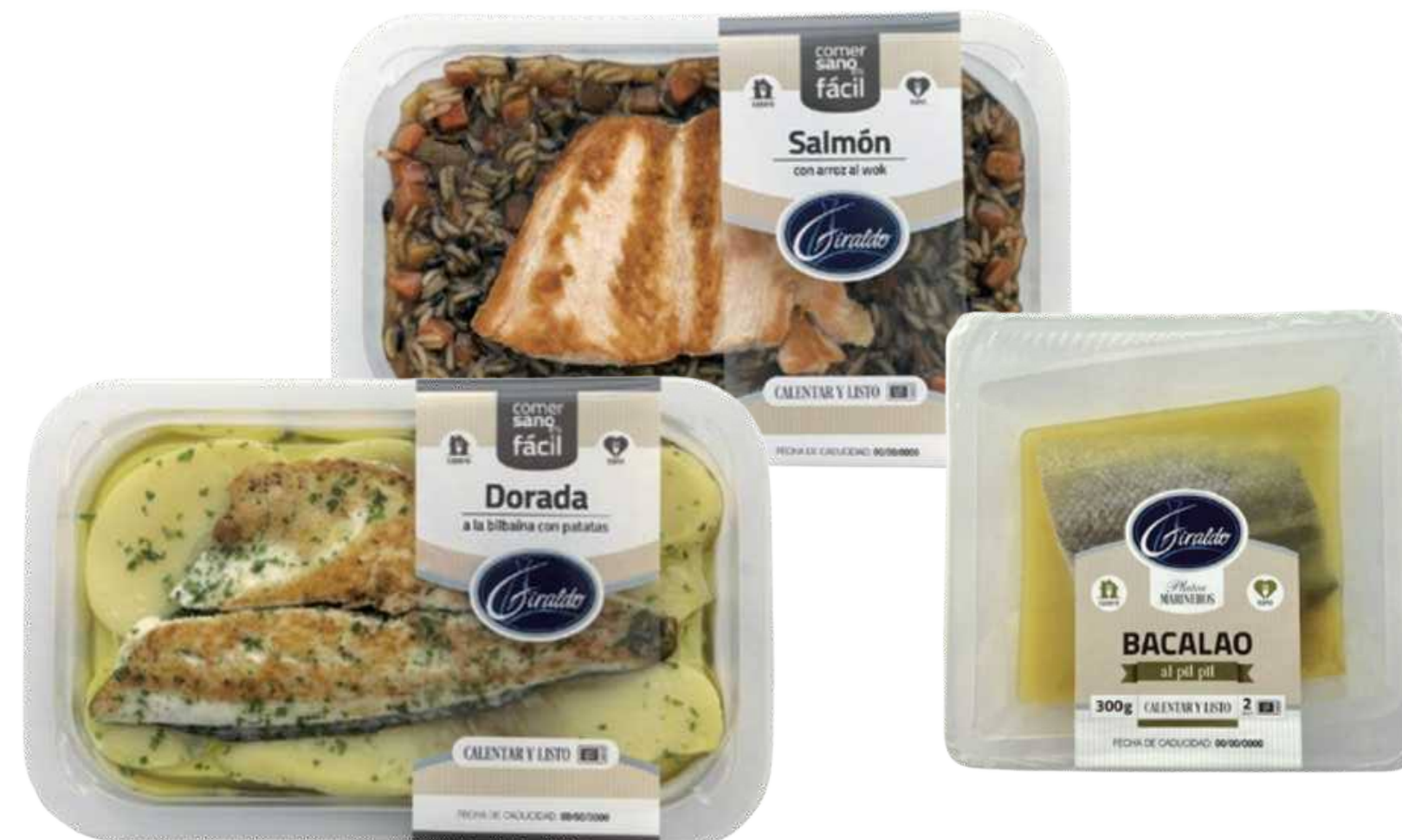
Plats V Gamme