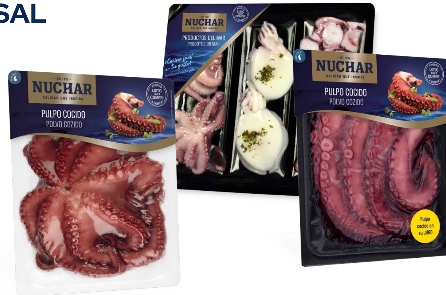
Céphalopodes Cuits & Préparations de Fruits de Mer