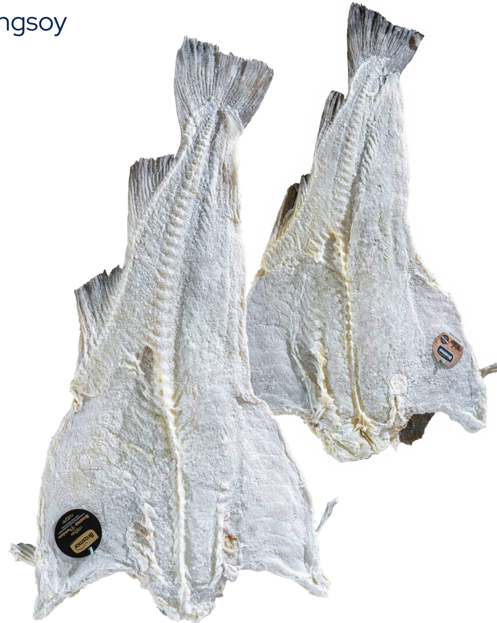
Morue Salée Verte et Séchée