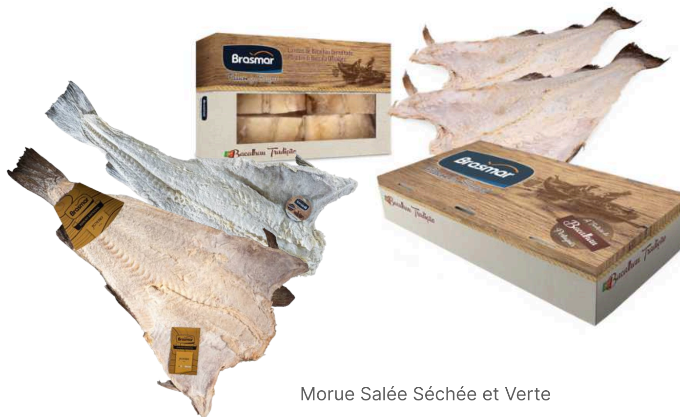
Morue Salée Séchée et Verte