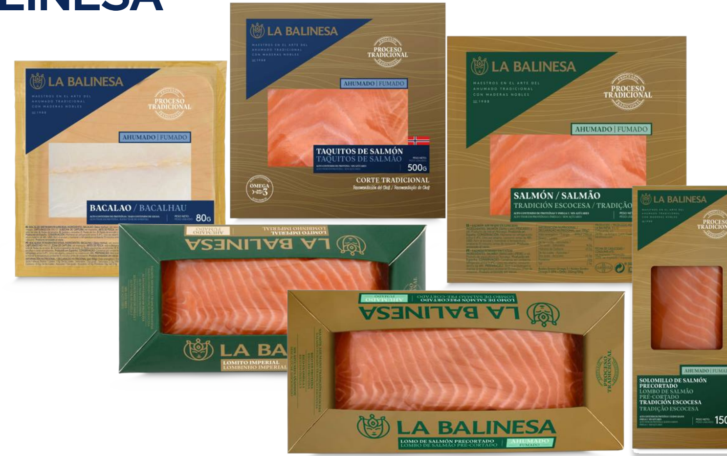
Fumés & Carpaccios Réfrigérés