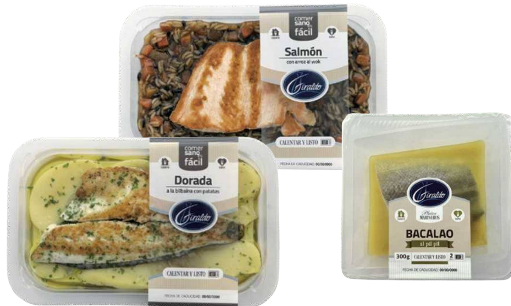
Piatti V Gamma