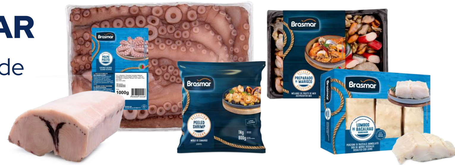
Baccalà, Polpo, Frutti di Mare & Pesce Surgelato