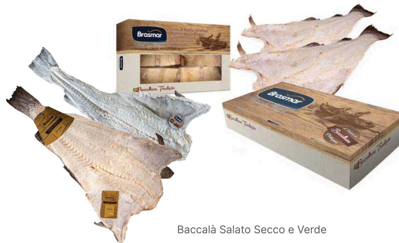
Baccalà Salato Secco e Verde