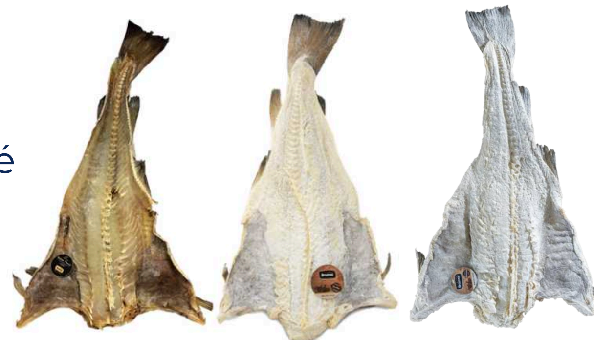
Baccalà Salato Secco e Surgelato