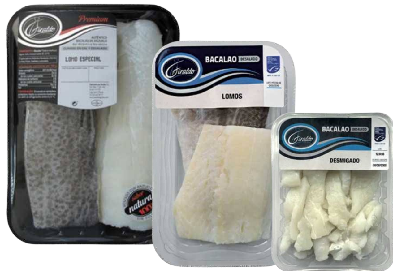
Baccalà Ammollato Refrigerato